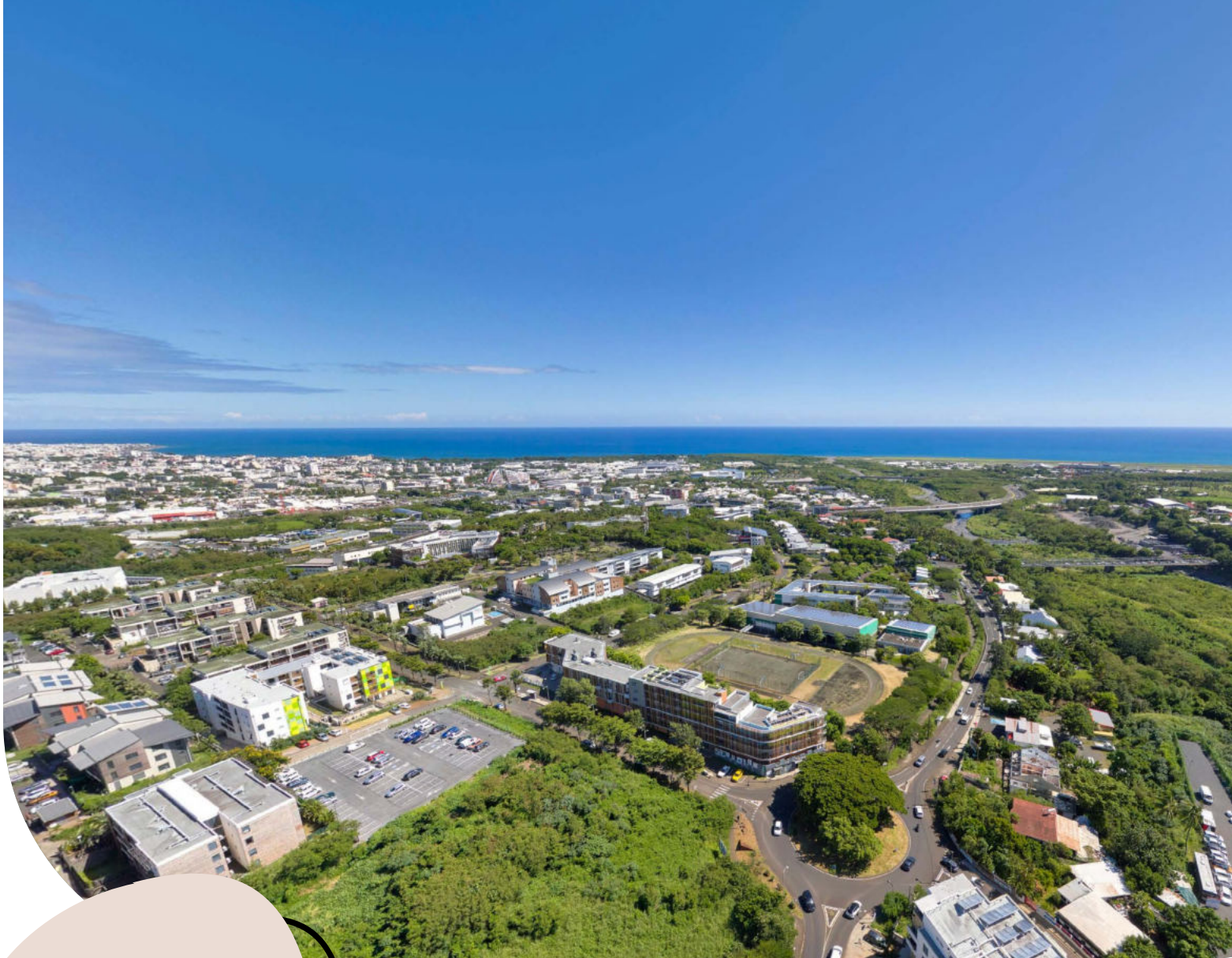
Vue depuis la résidence